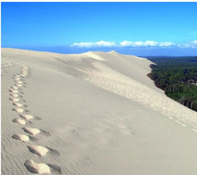
Dune du Pilat

Reliefdaten: https://maps-for-free.com ("MFF-maps are released under Creative Commons CC0") sowie © https://www.openstreetmap.org/copyright